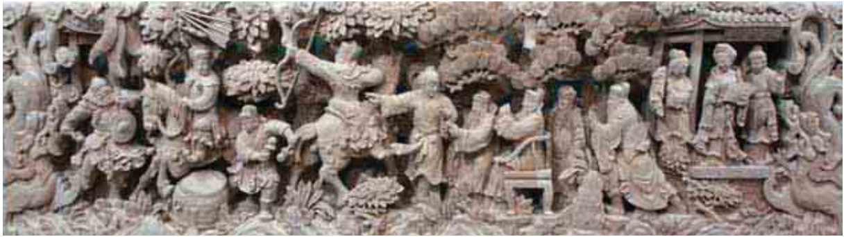
▲「比箭招親」人物圓光教案題材。

「三絲品蓮」窗花教案題材，圖稿內容物件計有鸞鷲、大獅子、小獅子各一隻，蓮花、蘆葦等。鸞鷲、大獅、小獅等這三件內容物件，其發音皆同「司」的發音，故稱為三絲。「品蓮」則釋義為：人格、品行、端正清廉，如蓮花一般，出淤泥而不染，品德高尚，剛正不阿。三絲原意是指「三司」，「絲」與「司」是同音異字。在構圖上三絲常以三隻鸞鷲，或三隻獅子，或一鸞兩獅子，或兩鸞一獅子，皆可成為三絲的代表，隱喻三個重要機關的各司其職，公正清廉，國家就能強盛安定。