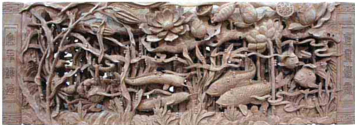
▲「禮廉傳家」水族圓光教案題材。

「禮廉傳家」水族圓光教案題材圖稿設計物件為：鯉魚、鯪魚、金魚、螃蟹、石頭、水草、水波紋、蓮花、莖、葉、水氣泡、蘆葦、帶狀水草、球狀水草。「禮廉傳家」是一句家訓用語，教案主題充分取用內容物件「鯉魚、鯪魚、蓮花、蘆葦」的相近諧音及隱喻內涵取名，以符合善良民風的題材運用。