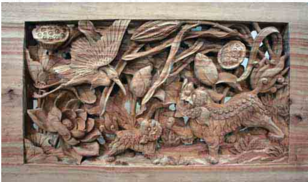
▲「三絲品蓮」窗花教案題材。

蓮花為荷屬睡蓮科，為多年生草本植物，亦稱荷花。古人以其「出淤泥而不染」而視之為清高，佛教亦表示佛的聖潔，民間則以「蓮」諧音「廉」、「連」，「荷」諧音「和」、「合」為用。