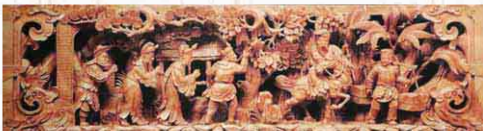
▲劉關張別徐庶（三國演義）