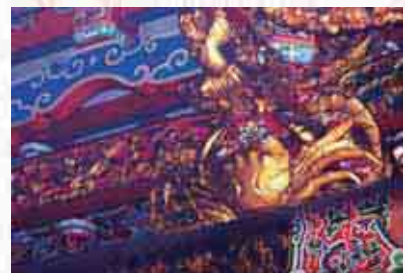
▲甲殼動物的螃蟹，常引用為甲。

釋意：清代科舉制度考試的最高等級為殿試，成績分為三甲，第一甲的第一名為狀元、第二名榜眼、第三名探花。第二甲、第三甲的第一名為傳臚，後期，改為第二甲的第一名才稱為傳臚。